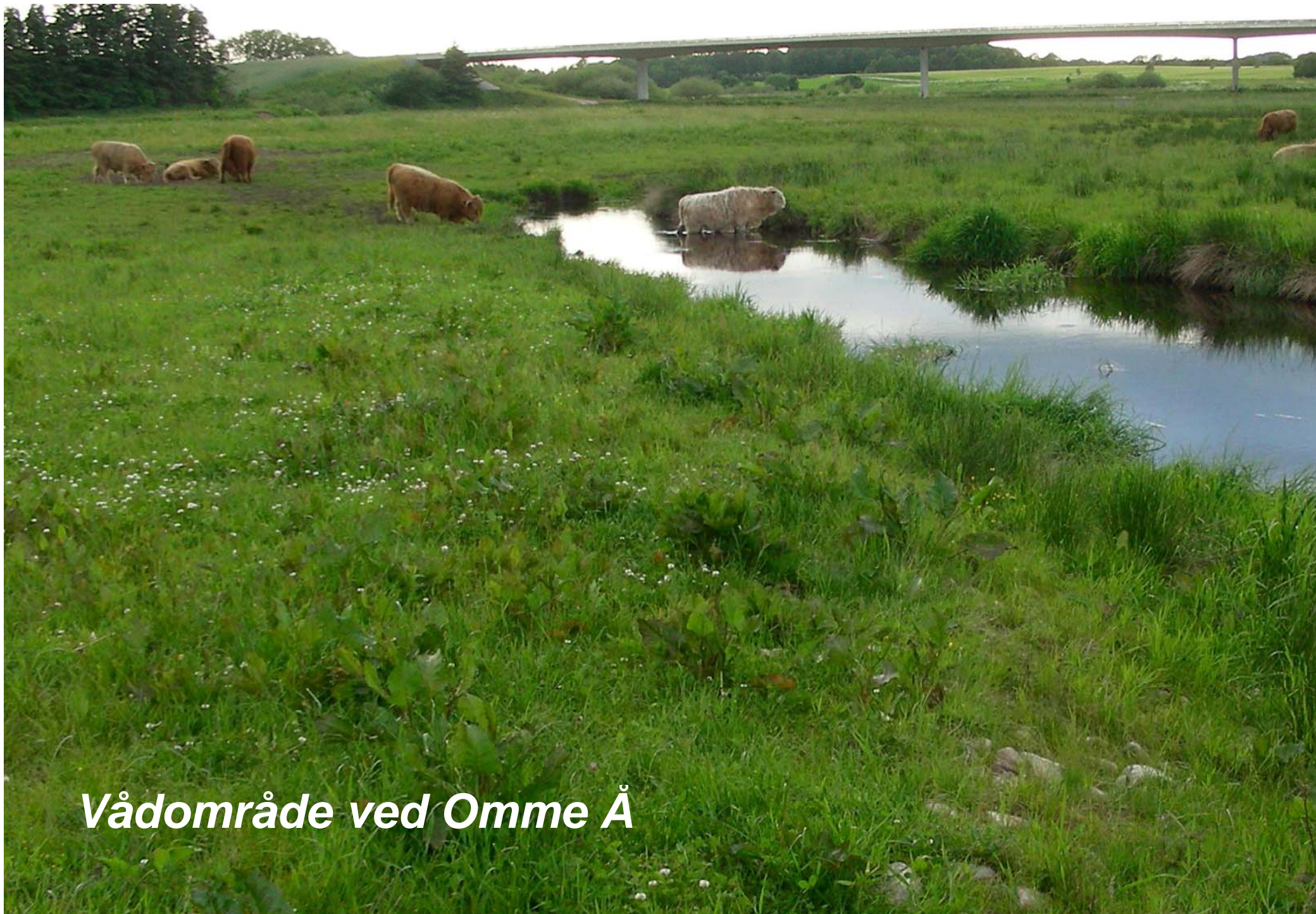
Vådområde ved Omme Å