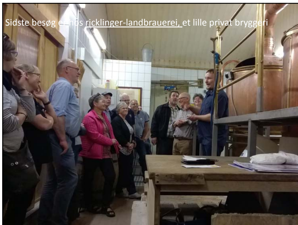
Sidste besøg er hos ricklinger-landbrauerei, et lille privat bryggeri