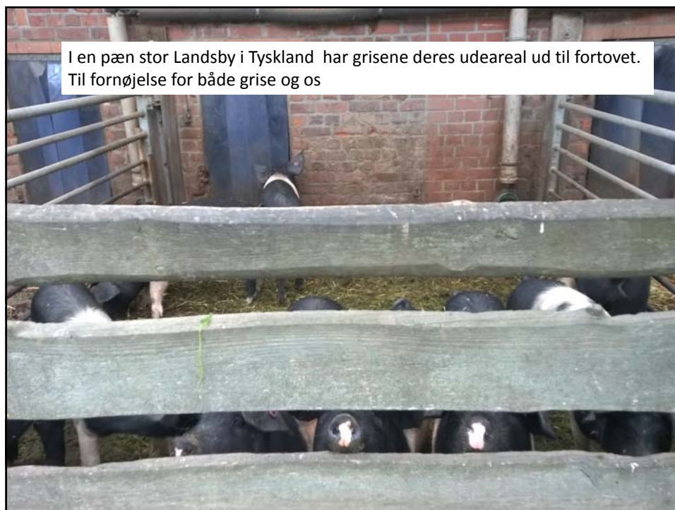
I en pæn stor Landsby i Tyskland har grisene deres udeareal ud til fortovet. Til fornøjelse for både grise og os